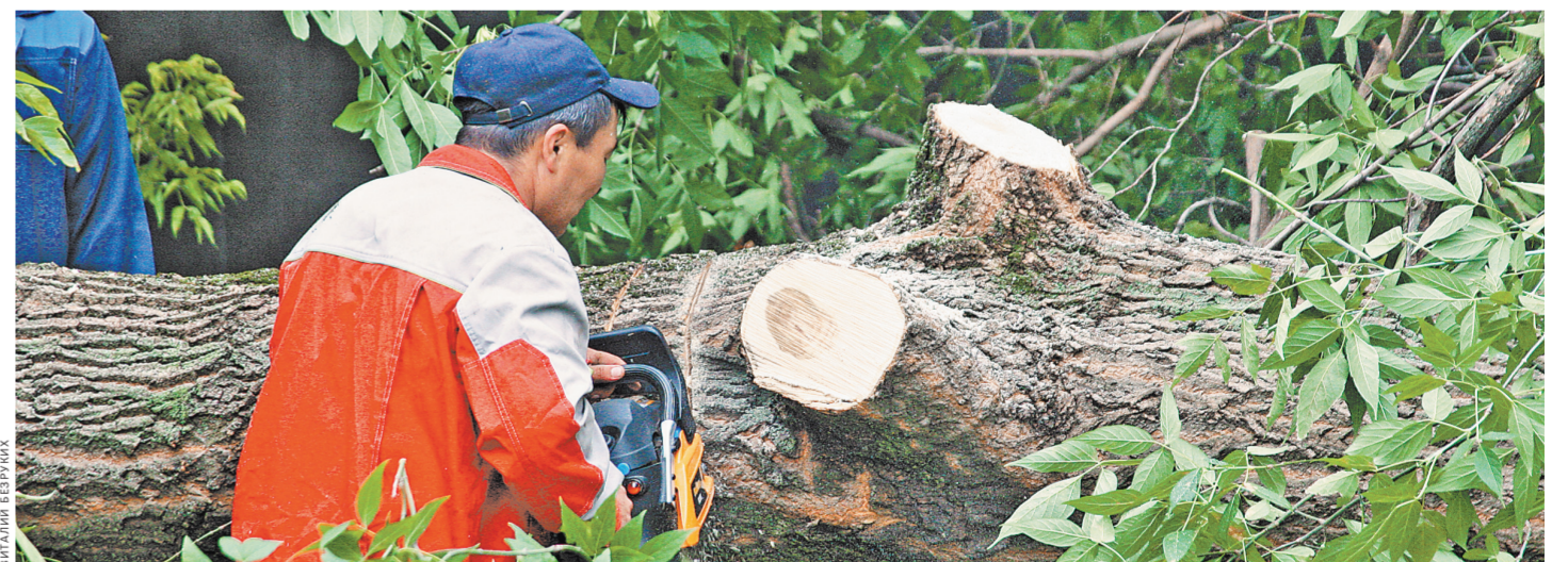
Упавшие деревья убрали полторы тысячи рабочих.