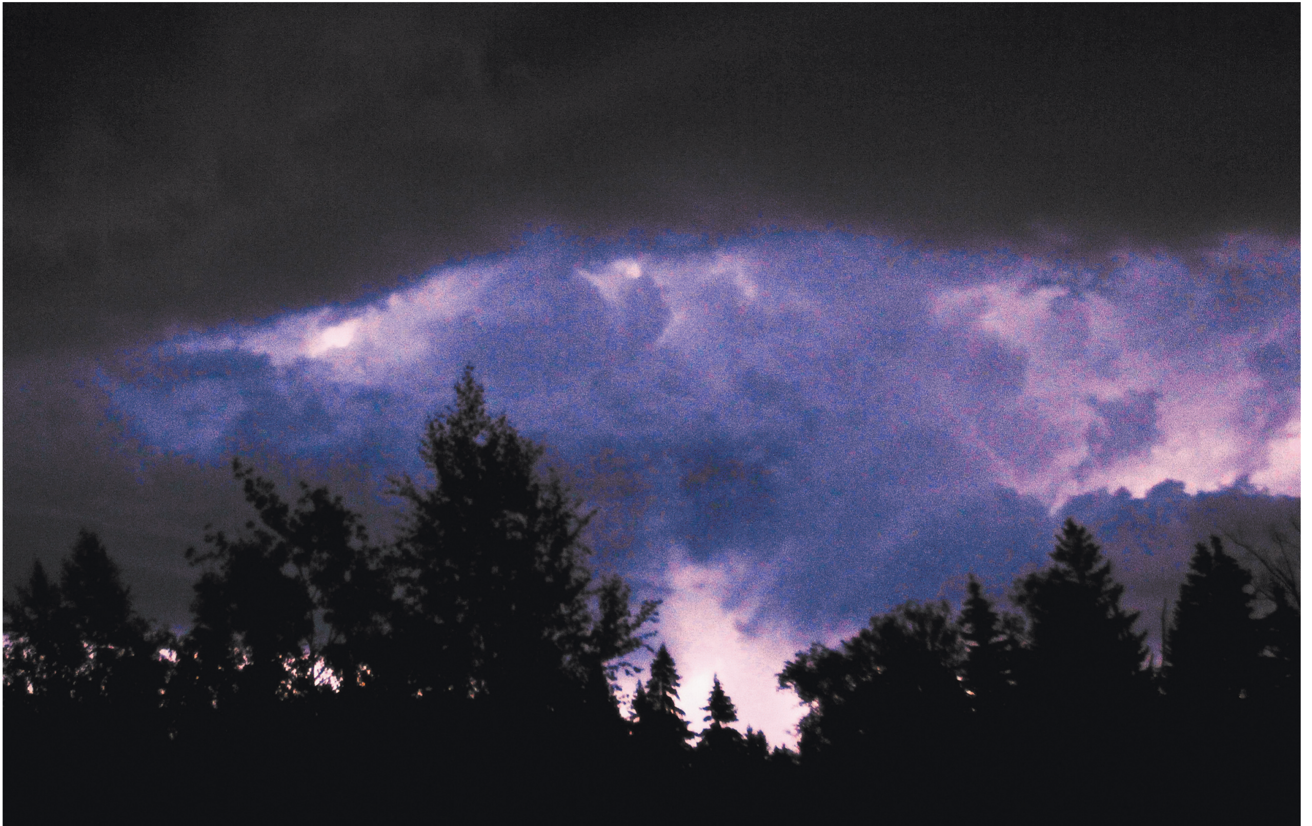
По уверению главы Гидрометцентра России Романа Вильфанда, гроза над городом была впечатляющей, но не уникальной.

Фото и видео на сайте www.rg.ru/art/1283449