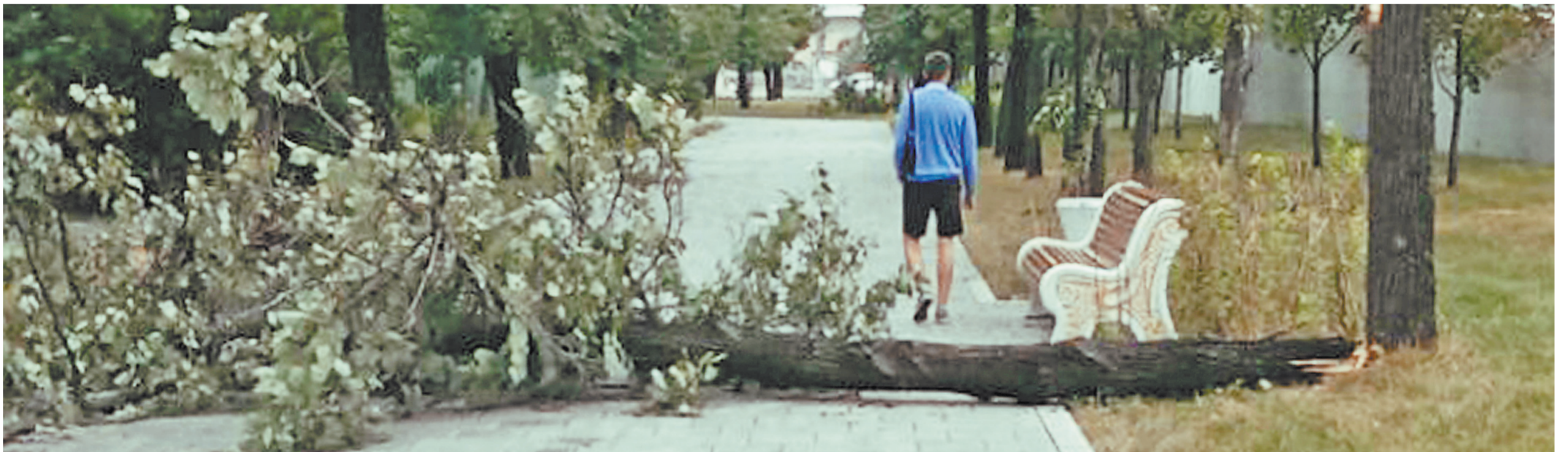
Разбушевавшаяся стихия повалила в городе тысячу деревьев.