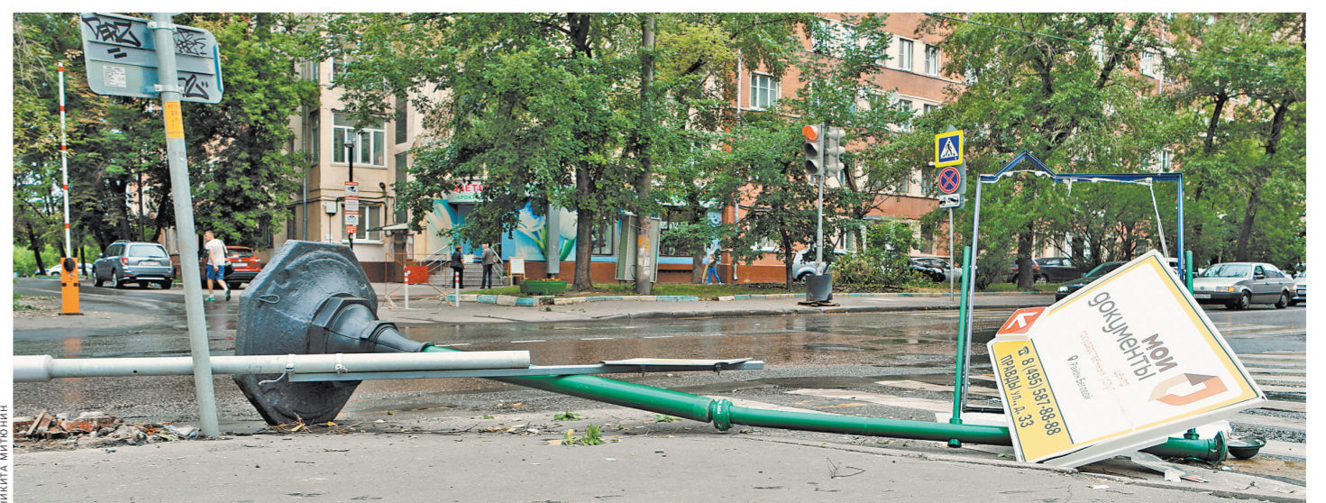
Фонарные столбы тоже не устояли под натиском московского урагана.