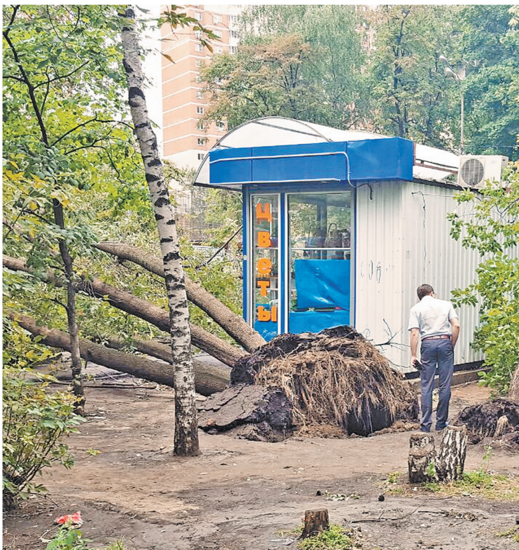
Некоторые — вырвала с корнем.